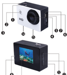
Imagen de la carcasa impermeable